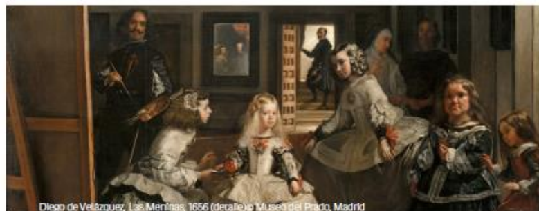
Diego de Velázquez, Las Meninas, 1656 (detalle) Museo del Prado, Madrid