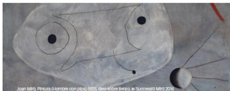
Joan Miró, Pintura (Hombre con pipa), 1925, óleo sobre lienzo. © Sucesión Miró 2016

Descárgate la App Paseo del Arte Imprescindible y descubre las veinticuatro obras maestras que no te puedes perder en Madrid.