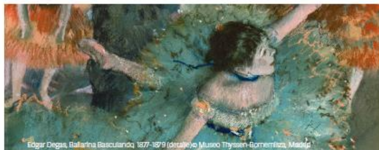
Edgar Degas, Ballerina Basculando, 1877-1879 (detalle) Museo Thyssen-Bornemisza, Madrid